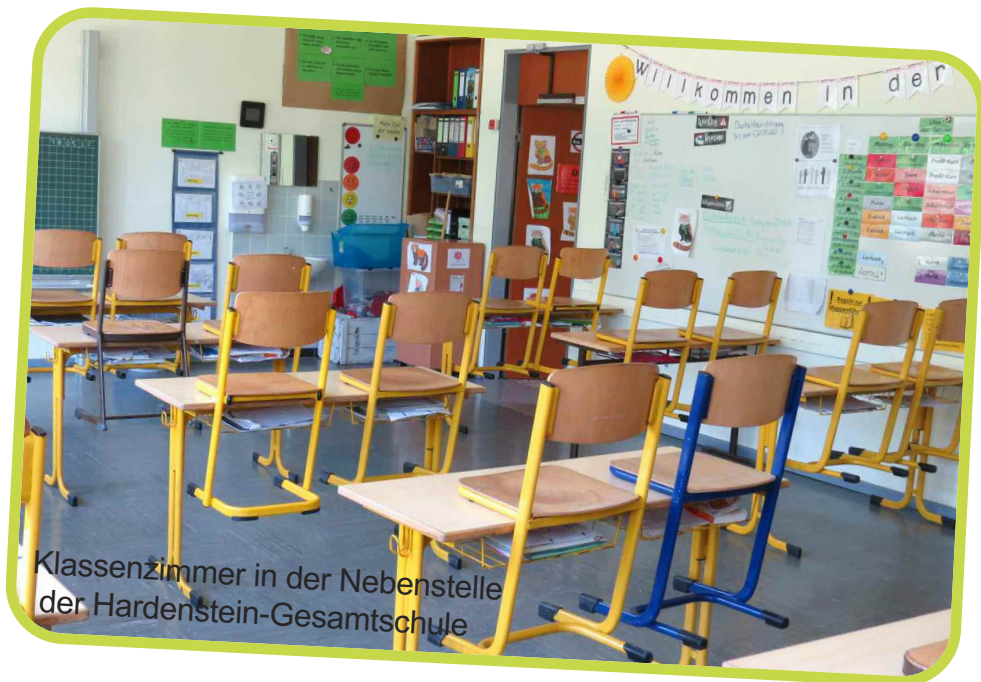
Klassenzimmer in der Nebenstelle der Hardenstein-Gesamtschule

Telefonisch haben Sie vor Unterrichtsbeginn oder in den Mittagspausen die größten Chancen, über das Sekretariat der Nebenstelle die Lehrkräfte zu erreichen: 02302 581 5570