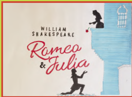
Darstellen und Gestalten